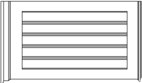
Konserwacja i rekonstrukcja boazerii w pom. 2.7 o pow. 7,62 m2 w pięciu segmentach: 1,29 x 0,75 1,29 x 1,63 1,29 x 0,87 1,29 x 0,94 1,29 x 1,77